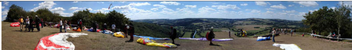
déco SW pilotes en attente

Coupe de France de Plaine de parapente 2006 : Jongler avec la météo