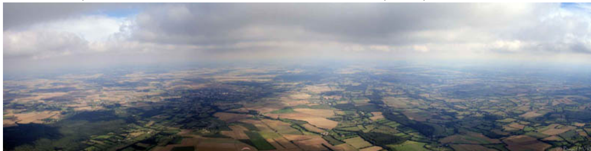
En approche de Falaise Manche 1

La première épreuve est un temps mini de 44 km vers l'ouest. La sortie du site est difficile en début de fenêtre pour les prétendants au goal car les conditions ne sont pas suffisamment installées. De nombreux pilotes se posent en bas des 190m de dénivelé du site de Saint Omer. Les quatre navettes font le maximum de rotations pour faire redécoller les pilotes. Philippe Leclerc, pilote local, suivit de Franck Arnaud sont les premiers à s'extraire dans de petites conditions. Plus tard, Arnaud Sécher enroule tout ce qu'il trouve. Puis plusieurs grappes successives prennent le chemin des nuages alors que les conditions s'améliorent, elles deviennent même fumantes. Les derniers sortent dans du plus 4m/s « bien gras ». Ils cheminent en s'appuyant sur les premiers qui balisent les thermiques. Ils rattrapent finalement la tête de la course qui a multiplié les points bas à moins de 100m sol. 19 pilotes finissent au but. Daniel Vincent Genod est le plus rapide.